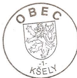
Ing Zdeněk Špitálský starosta

Obec Kšely vyhláší záměr o bezplatné výpůjčce pozemků p.č. 532/1 o výměře 4834 m 2 , p.č. 532/2 o výměře 4071 m 2 a p.č. 790/2 o výměře 540 m 2 , vše v k.ú. Kšely, za účelem sportovního využití mládeže ( hřiště pro kopanou) předem určenému zájemci (TJ Podlipan Kšely) a to na dobu neurčitou s výpovědní lhůtou 6-ti měsíců, počínaje dnem 1.1.2015.